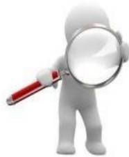
Tipos de Solicitudes