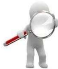
Tipos de Solicitudes